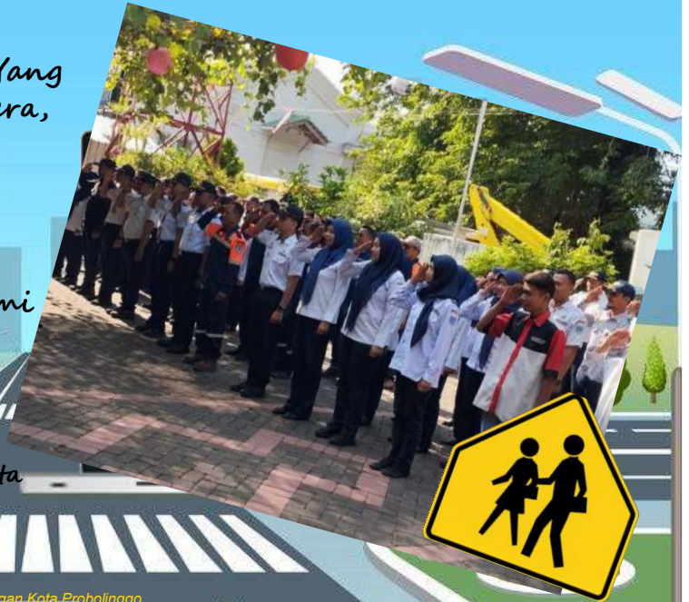
Dinas Perhubungan Kota Probolinggo

Terwujudnya Infrastruktur Perhubungan yang Aman dan Merata