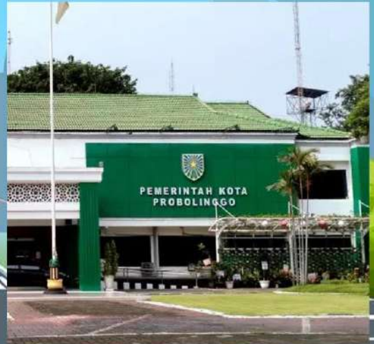
Dinas Perhubungan Kota Probolinggo